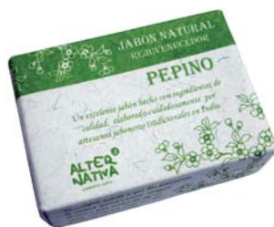
Jabón pepino cod. 594391 100g