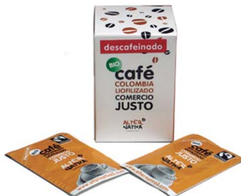
sobres monodosis cod. 008006 pack 10 sobres cod. 008005 caja 375 sobres