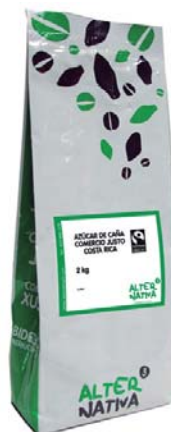
cod. 008012 bolsa 500g