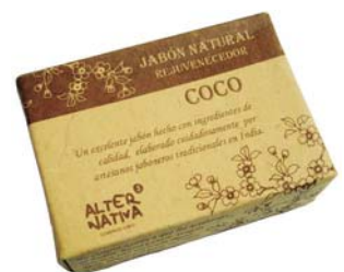
Jabón coco cod. 594392 100g