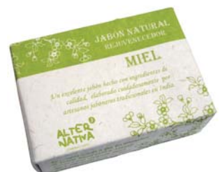
Jabón miel cod. 594395 100g