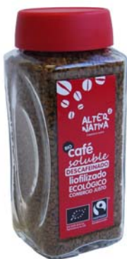
cod. 008029 pet 100g

Nuestro café descafeinado liofilizado ha sido sometido a los más modernos procesos de solubilización, de forma que el producto final conserva todas sus excelentes propiedades de aroma, sabor y color. Las mejores cualidades de los grandes cafés se mantienen intactas en este café natural, suave y de agradable fragancia. Descafeinado sin utilizar productos químicos agresivos para la salud y el medio ambiente. 100% Arabica