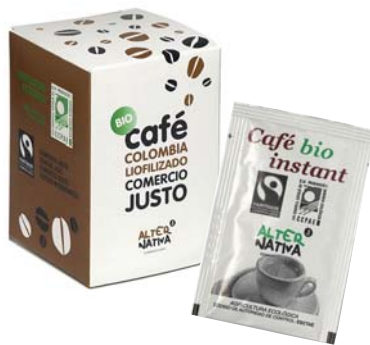
sobres monodosis cod. 008016 pack 10 sobres cod. 008015 caja 375 sobres