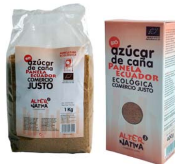
Azúcar de caña Panela cod. 023304 400 g cod. 023302 1 Kg cod. 023305 5 Kg

Mascobado es el nombre con que se conoce en Filipinas al azúcar de caña integral. Es un azúcar no refinado que conserva todas las sustancias nutritivas.