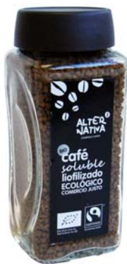
cod. 008008 pet 100g

Nuestro café liofilizado ha sido sometido a los más modernos procesos de solubilización, de forma que el producto final conserva todas sus excelentes propiedades de aroma, sabor y color. Ideal para disfrutar en un instante del mejor café.