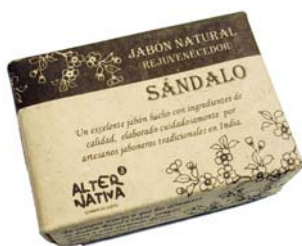
Jabón sándalo cod. 594390 100g

Tu compra ayuda a que los artesanos de Palam Rural Centre tengan acceso a una vivienda digna, agua, educación para sus hijos y asistencia sanitaria. Esta cooperativa está formada por un grupo de familias Harijan, de las castas más bajas de la sociedad hindú, al estado de Tamil Nadu, al sur de la India, los intocables. Gracias a las redes de Comercio Justo, han conseguido levantar un centro médico y escuelas, algo impensable para esta casta en otros tiempos.