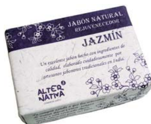
Jabón jazmín cod. 594394 100g