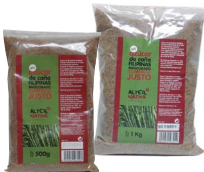
Azúcar de caña Mascobado cod. 026300 500 g cod. 026301 1 Kg

Mascobado es el nombre con que se conoce en Filipinas al azúcar de caña integral. Es un azúcar no refinado que conserva todas las sustancias nutritivas.