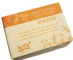
Jabón mango cod. 594393 100g