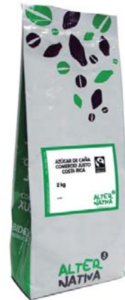
cod. 008007 bolsa 500g