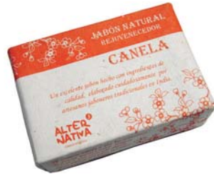
Jabón canela cod. 594397 100g