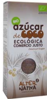
Azúcar de coco cod. 027000 250 g

Sabor dulce, con un toque a caramelo. Contiene hierro, zinc, potasio, antioxidantes y fibras dietéticas. El azúcar de coco se extrae de la savia de la flor de la palmera cocotera sólo por evaporación. Tiene un índice glucémico bajo (35), lo que ayuda a evitar que al consumirlo los niveles de azúcar en sangre se disparen rápidamente y luego caigan bruscamente. Contiene Inulina, que ayuda a retrasar la absorción de la glucosa.