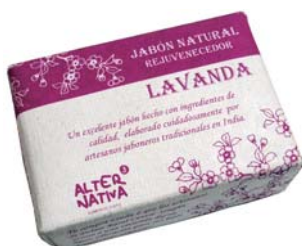
Jabón lavanda cod. 594396 100g