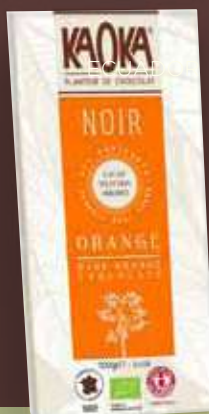
KAOKA NEGRO NARANJA (CACAO 55%)