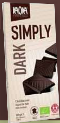
KAOKA SIMPLY "DARK" (CACAO 61%)