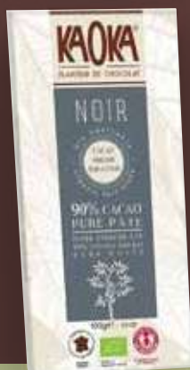
KAOKA NEGRO (CACAO 90%)