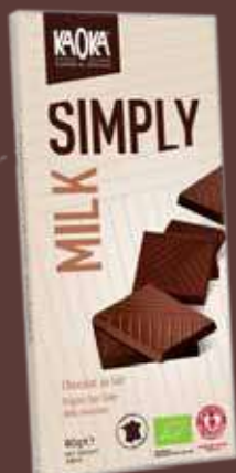
KAOKA SIMPLY "MILK" (CACAO 32%)