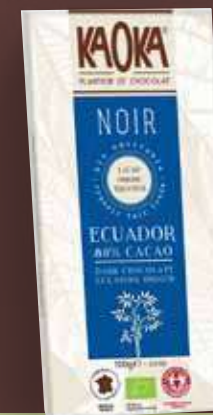
KAOKA NEGRO (CACAO 80%)