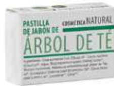
PASTILLAS DE JABÓN