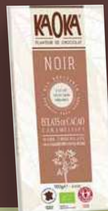
KAOKA CON CACAO CAMELIZADO (CACAO 61%)