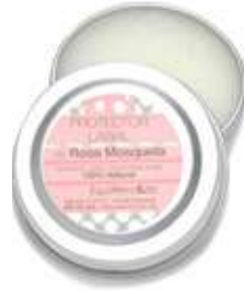
LABIOS Y OJOS