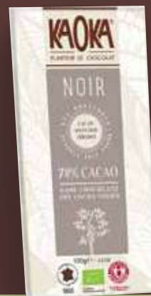
KAOKA NEGRO (CACAO 70%)