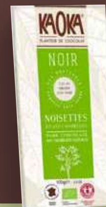
KAOKA CON AVELLANAS CAMELIZADAS (CACAO 66%)